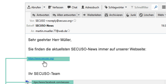
Webadresse in der Statusleiste (z. B. bei Thunderbird oder Webbrowsern wie Firefox, Internet Explorer und Chrome)

Bei mobilen Geräten (Smartphones und Tablets) hängt das Vorgehen zum Identifizieren der Webadresse eines Links stark vom Gerät und von der jeweiligen App ab. Meist ist es so: Wenn Sie Ihren Finger für mindestens 2 Sekunden auf dem Link halten, dann wird die Webadresse im Dialogfenster angezeigt. In manchen Android Apps gibt es diese Funktion nicht oder führen etwas anderes aus. Achten Sie darauf, dass Sie den Link dabei nicht versehentlich anklicken. Wenn Sie unsicher sind, warten Sie, bis Sie wieder an Ihrem PC oder Laptop sind.