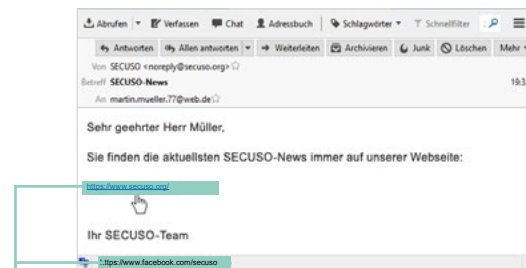
Webadresse in der Statusleiste (z. B. bei Thunderbird oder Webbrowsern wie Firefox, Internet Explorer und Chrome)

Bei mobilen Geräten (Smartphones und Tablets) hängt das Vorgehen zum Identifizieren der Webadresse eines Links stark vom Gerät und von der jeweiligen App ab. Meist ist es so: Wenn Sie Ihren Finger für mindestens 2 Sekunden auf dem Link halten, dann wird die Webadresse im Dialogfenster angezeigt. In manchen Android Apps gibt es diese Funktion gar nicht oder führen etwas anderes aus. Achten Sie darauf, dass Sie den Link dabei nicht versehentlich anklicken. Wenn Sie unsicher sind, warten Sie, bis Sie wieder an Ihrem PC oder Laptop sind.